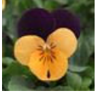
Orange Jump Up Improved