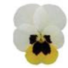
Lemon Ice Blotch