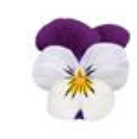
White Jump Up