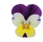
Lemon Jump Up