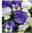
Blueberry Sundae Mixture