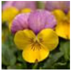
Yellow Pink Jump Up