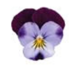
Denim Jump Up