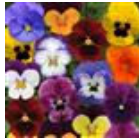
Autumn Select Mixture