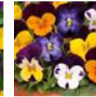
Jump Up Mixture