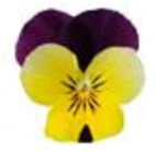
Yellow Jump Up